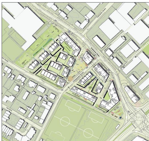
Entwurf Wick + Partner

Bei der Überprüfung der Realisierbarkeit hat sich aber ergeben, dass ein Verschwenk der Ensisheimer Straße durch mehrere vorhandene unterirdische Leitungen nicht refinanzierbar ist. Die Bewertungskommission hat für diesen Fall empfohlen die stadträumliche Untergliederung in blockartigen Strukturen weiterzudenken. Diese scheinen die lärmbezogenen Rahmenbedingungen aufzugreifen und gleichzeitig attraktive Wohnviertel generieren zu können. Die Stadtverwaltung hat dementsprechend für das städtebauliche Rahmenkonzept „Stadtteil Mooswald“ die Entwurfsarbeit des Planungsbüros „Pesch Partner“ als Grundlage gewählt. Hingewiesen wird auf die Bedeutung des vorhandenen Bolzplatzes an der Ecke Ensisheimer Straße/Berliner Allee.